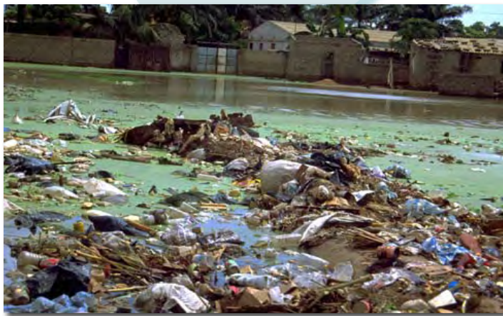
Inundaciones en Bangladesh, 2006

■ La infraestructura de salud pública , incluyendo los sistemas de salud, el desarrollo de leyes y regulaciones de seguridad química, su vigilancia y aplicación, son críticos para la minimización del daño, de las enfermedades relacionadas con el cambio climático y la exposición a químicos. En aquellas áreas donde se carece de servicios básicos, la población entera está en riesgo.