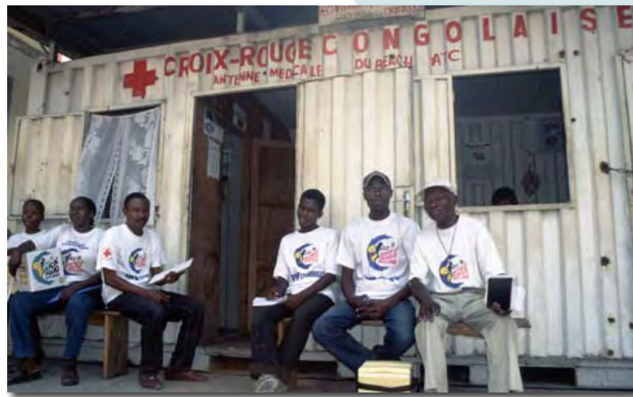
Las ONG tratan de cumplir con los objetivos, pero la demanda crecerá en la medida en que se acelera el cambio climático.