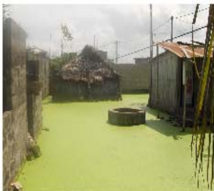
Inondations au Bénin, (Photo, Archives OMS Bénin)