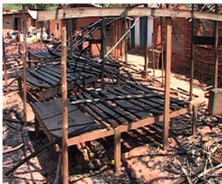
Horreur à Dongo, Province Equateur/RDC: le marché et des habitations brûlés