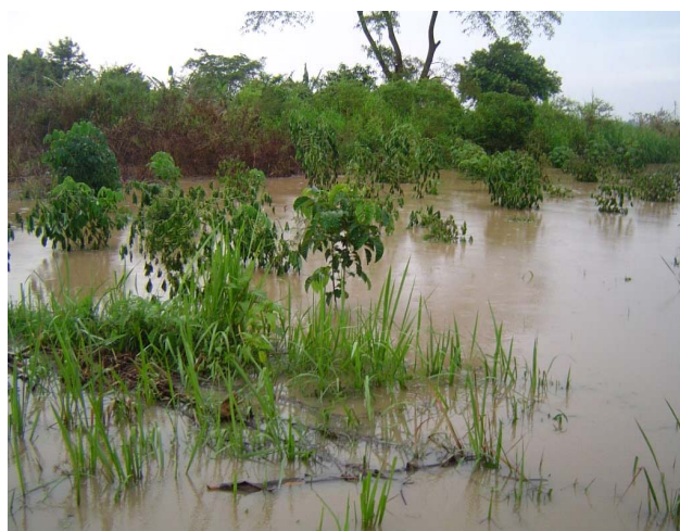
Champ de manioc submergé par l'inondation