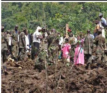
L'armée ougandaise et des villageois fouillent une zone où le glissement de terrain a englouti tout un village.