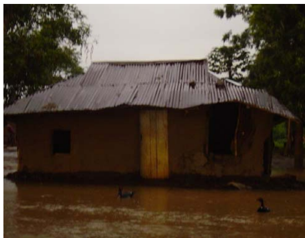
Des cases qui risquent de s'effondrer à tout instant