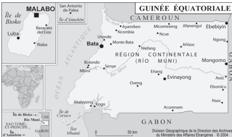
Situation g  ographique de la Guinée   quatoriale

La R  publique de Guinée   quatoriale est le plus petit pays d'Afrique centrale. Le pays est divis   en 2 r  gions : la r  gion continentale (Rio Muni) et la r  gion insulaire avec l'  le Annobon dans l'Oc  an Atlantique et l'  le de Bioko (ancien Fernando Po) o   se trouve la capitale Malabo. La superficie totale du pays est de 28 051 km 2 . La Guinée   quatoriale compte sept provinces subdivis  es en 18 districts. Le district repr  sente l'unit   politico-administrative de gestion de la sant  .