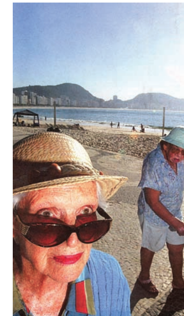
© AGÊNCIA O GLOBO Márcia Foletto 2005

Le cœur du Guide est la feuille de route des caractéristiques des villes amies. Cette feuille de route n'est pas destinée à montrer du doigt une ville par rapport à une autre, mais plutôt d'être pour elles un référentiel d'auto-évaluation et un outil de planification à dessein d'améliorer la condition de vie de leurs aînés. Aucune ville n'est retardée au point qu'elle ne puisse y apporter un progrès substantiel basé sur la feuille de route. Il est même possible d'aller au-delà de cette feuille de route et il y a déjà quelques villes qui ont élargi son cadre. Les pratiques avérées sont source d'idées que d'autres villes peuvent intégrer.